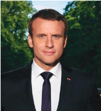
Emmanuel Macron Président de la République